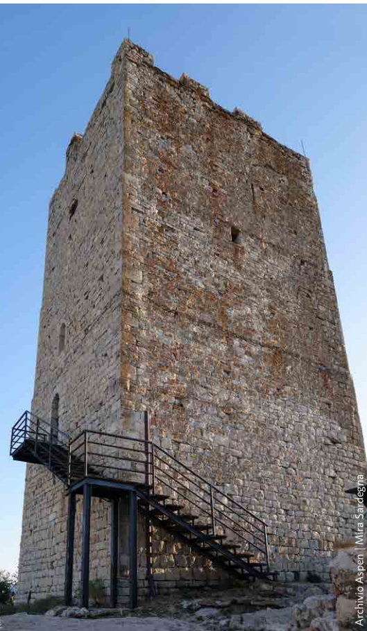
Archivio Aspen | Mira Sardegna